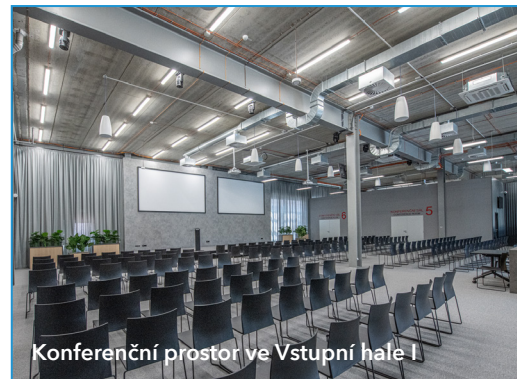
Konferenční prostor ve Vstupní hale I

Vystavovatelům lze nabídnout také pronájem salónek pro vlastní individuální produktové prezentace, workshopy nebo semináře ve Vstupní hale I.