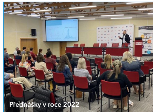
Přednášky v roce 2022